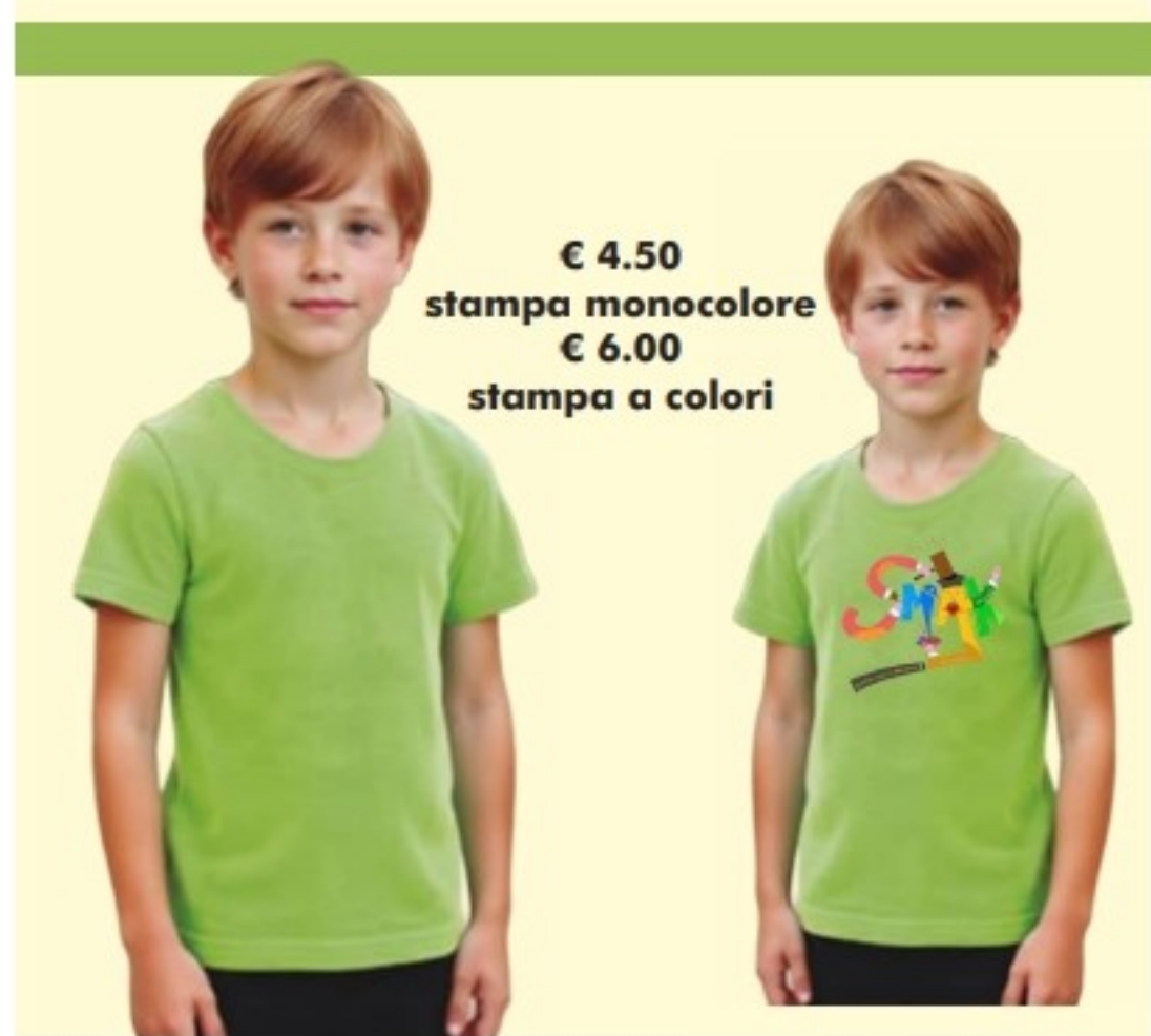
€ 4.50 stampa monocolora € 6.00 stampa a colori

GLI ORDINI VERRANNO EVASI ENTRO 15 GG LAVORATIVI