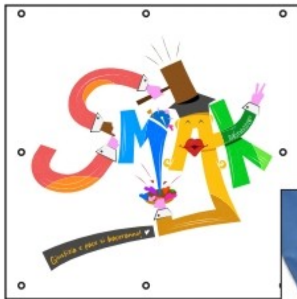
€ 30.00 al mq. Banner occhiellato st. colore