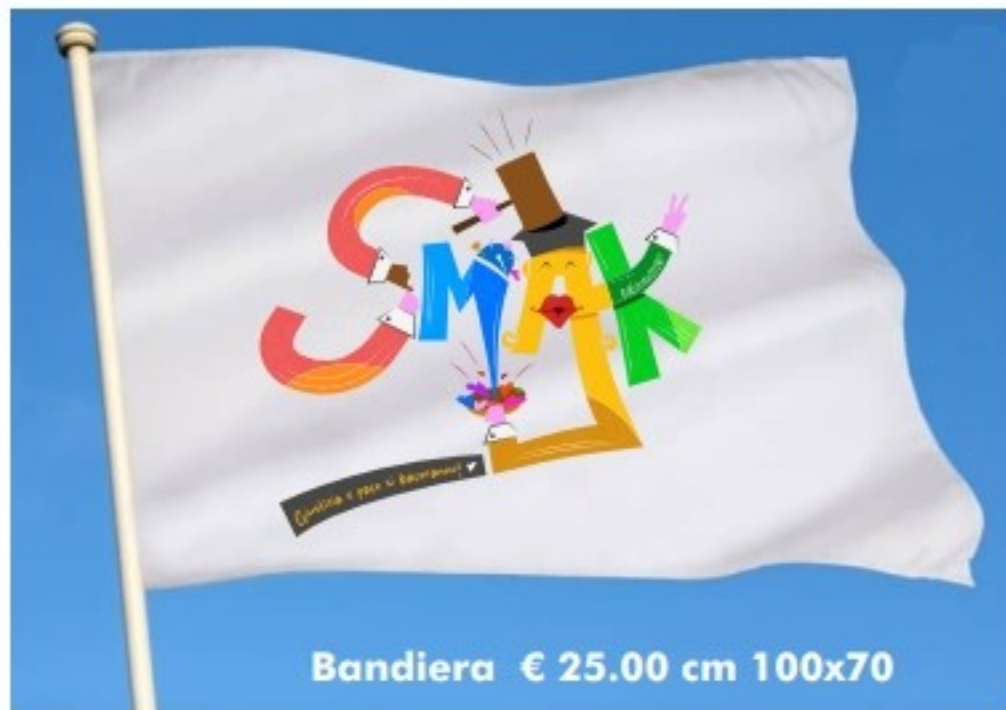
Bandiera € 25.00 cm 100x70